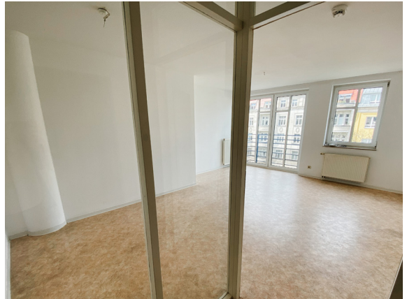
Wohnzimmer mit Aussicht